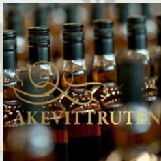
Akevittcruise, 8. juni

TIRSDAG 25. juni—18. august. Går i rute ihht tidtabellen.