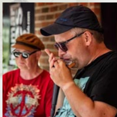
Bluescruise Bekken & Gjems

ONSDAG 29. mai: Gla'jazz med Gosen, fra Gjøvik TORS DAG 30. mai: Gla'jazz med Gosen, fra Hamar LØRDAG 1. juni: Club Roulotte, fra Gjøvik LØRDAG 8. juni: Akevittcruise, fra Hamar SØNDAG 9. juni: Årsmøte i Skibladners Venner TORS DAG 13. juni: Gosen Gla'jazz fra Moelv TORS DAG 13. juni: Gosen Gla'jazz fra Lillehammer SØNDAG 16. juni: Krigshistorisk reise m/Harald Sunde FREDAG 21. juni: Bluescruise med Hamar Bluesklubb LØRDAG 22. juni: Bryggfest Brumunddal brygge SØNDAG 23. juni: St. Hans feiring — se nettsiden TIRSDAG 25. juni: Start av rutesesongen med markeringer.